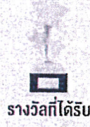
รางวัลที่ได้รับ

☎ กลุ่มงานส่งเสริมสิทธิมนุษยชน 02 141 3930 หรือ 02 141 3925 ☎ 08 2270 4360 หรือ 06 2492 4641 ✉ E-mail : hrpro62@nhrc.or.th