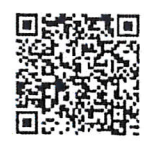
QR-Code ประกาศรับสมัคร/ใบสมัคร

ใส่ประกาศเกียรติคุณ และเงินรางวัล ๆ ละ 30,000 บาท